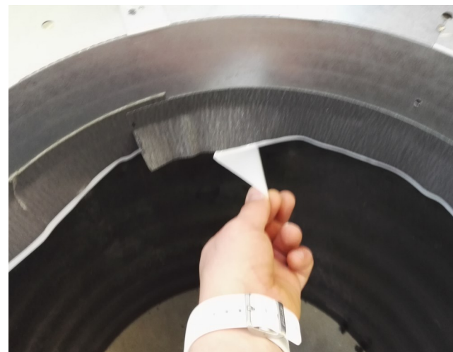
3. yläkaulusen tiivistäminen