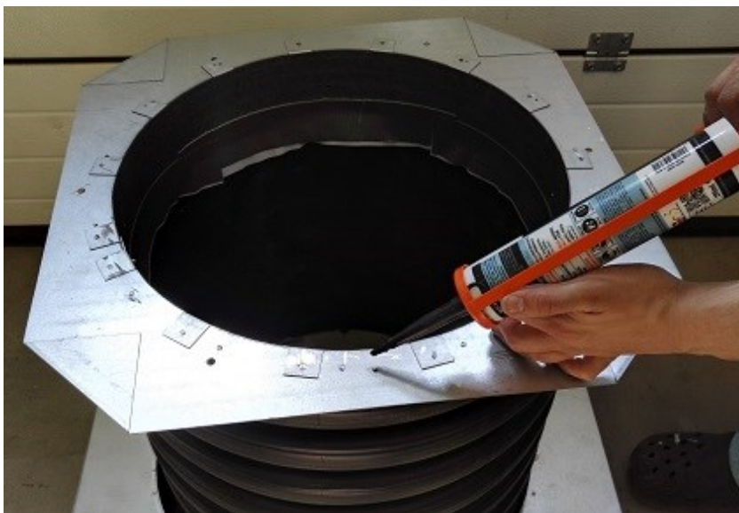
4. Liimamassan asennus