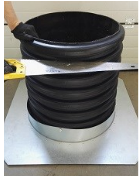
2. rumpu putken yläpään suoristus