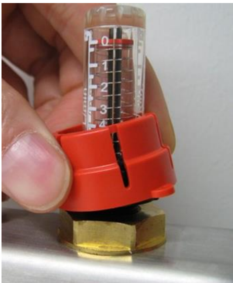
Kuva 3. Virtausmittarin lukitusosan poisto