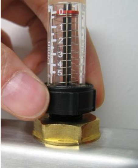
Kuva 4. Virtausmittarin pyörittys