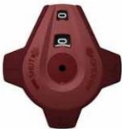
Kuva 1 Kiinni oleva venttiili