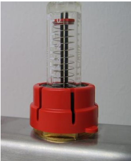
Kuva 5. Lukitusosa paikoillaan