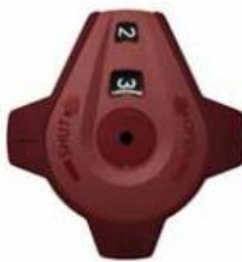
Kuva 2 Auki 2,3 kierrosta