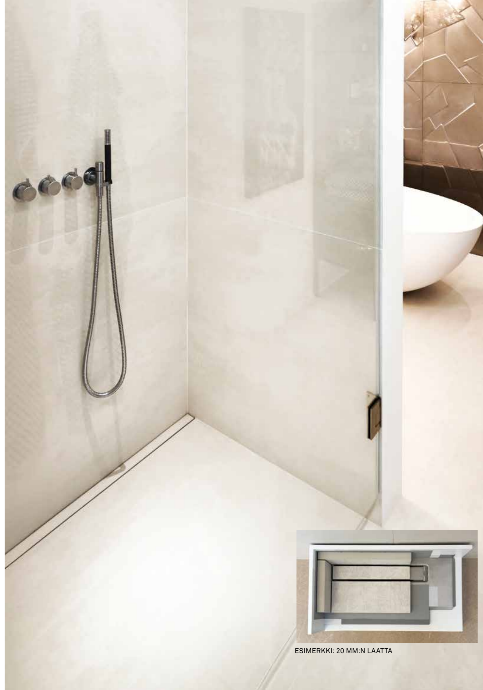
ESIMERKKI: 20 MM:N LAATTA